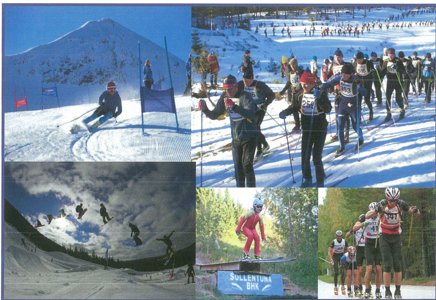
Grenar inom Stockholms Skidförbund bl a Alpint, Längdåkning, Freeride, Backhoppning, Rullskidor